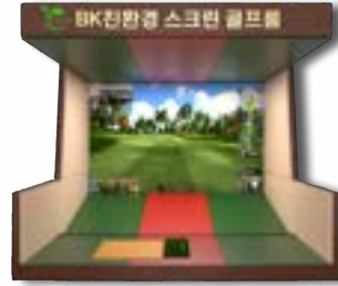
친환경 스크린 스포츠 룸 살펴 보기 ▶